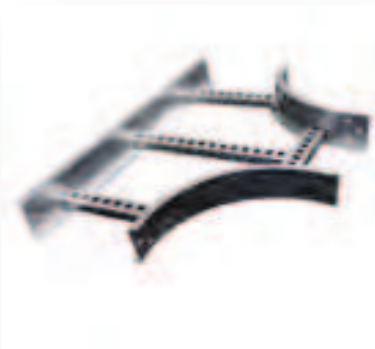
"T" Horizontal Código TH-Ancho-Radio